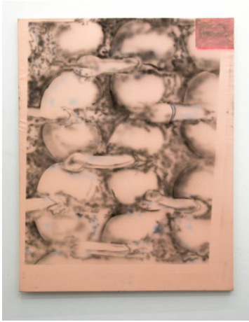
Unlimited Rationalization, Universal Enrollment...

Acrílico sobre terciopelo rosa, 140 x 118 cm