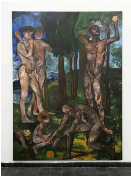
Trans Von Marées—Las estaciones de la vida