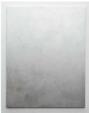
Thirteen Most Wanted Men (1 of 13)

Retrato mal ejecutado de Miss Piggy a partir de una foto personal de baja calidad de una pintura en el bar gay Roses en Orainenstrasse, Berlin.