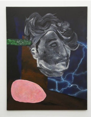
Imagen adaptada de una foto borrosa de la cuenta de Instagram de Richard Hawkins que fue eliminada después de 24 horas. Partes de la imagen fueron “censuradas” estilísticamente con una optimista paleta de colores que evoca bellas pinturas neo-formalistas y diseño tipo Memphis de principio de los años ochenta.